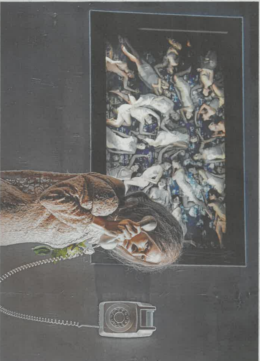
Before/After: technisch hoogstandje maar geen theaterervaring.